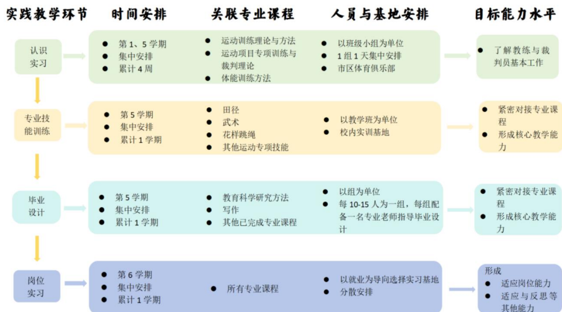
图 2 实践教学体系